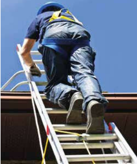
SVENSKARNA GÅR FÖRE. Finländska företag halkar efter om vi fortsätter som nu.